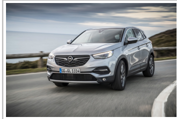
Opel Grandland X.