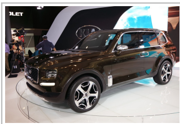
Kia Telluride Concept.