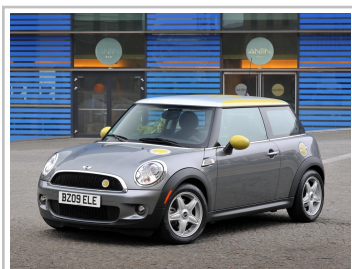
Mini Cooper Electric von 2008: ein Zweisitzer, randvoll mit Batteriezellen.