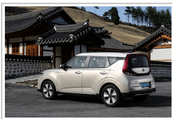
Kia Soul EV.