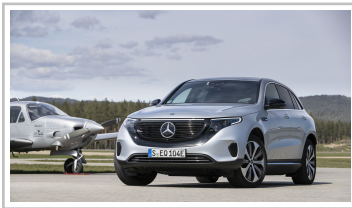
Mercedes-Benz EQC 400 4Matic.