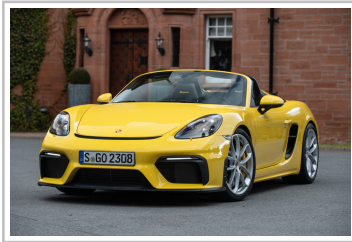
Porsche 718 Spyder.