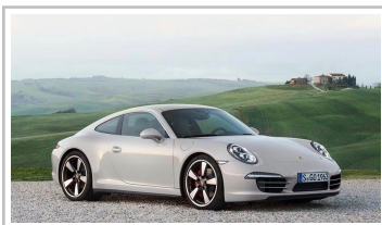
Porsche 911 Turbo.