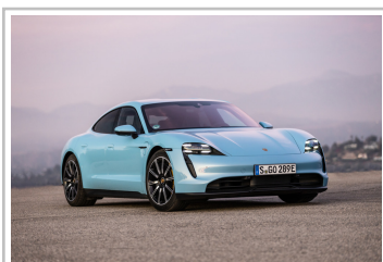
Porsche Taycan 4S.