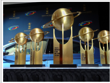
World Car of the Year 2015.