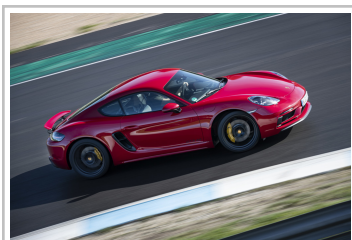
Porsche 718 GTS 4.0.