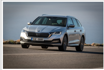
Skoda Octavia Combi.