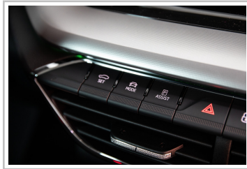
Skoda Octavia Combi.