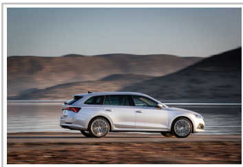
Skoda Octavia Combi.