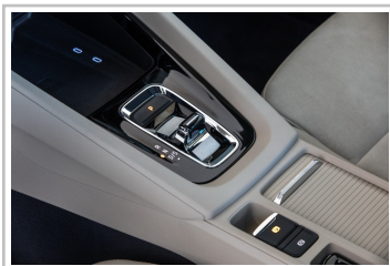
Skoda Octavia Combi.