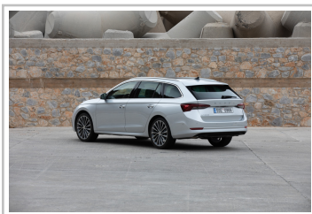
Skoda Octavia Combi.