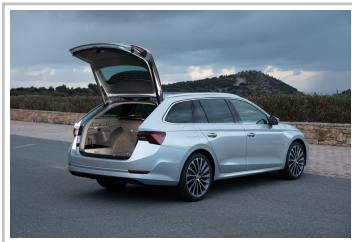
Skoda Octavia Combi.