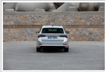
Skoda Octavia Combi.