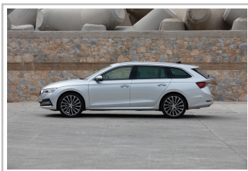
Skoda Octavia Combi.