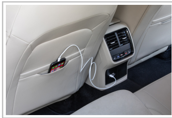
Skoda Octavia Combi.