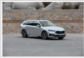
Skoda Octavia Combi.