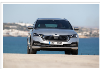
Skoda Octavia Combi.