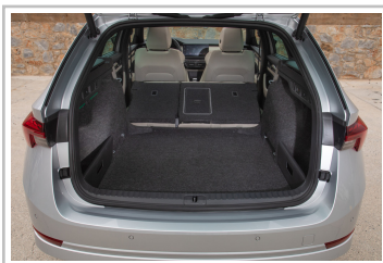
Skoda Octavia Combi.