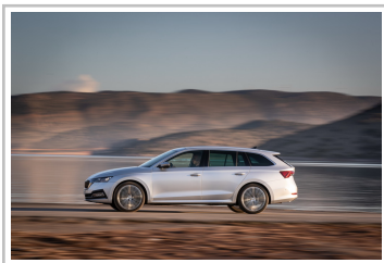
Skoda Octavia Combi.