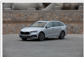
Skoda Octavia Combi.