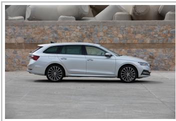
Skoda Octavia Combi.