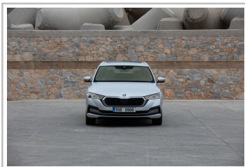
Skoda Octavia Combi.