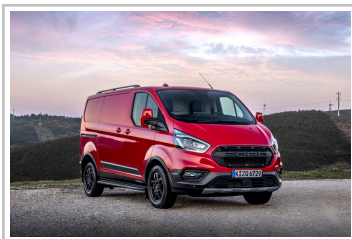
Ford Transit Custom Trail.