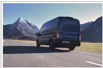
Ford Transit Trail.