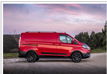
Ford Transit Custom Trail.