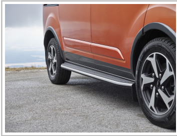
Ford Tourneo Custom Active.