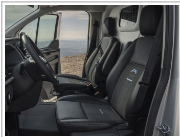
Ford Transit Custom Active.