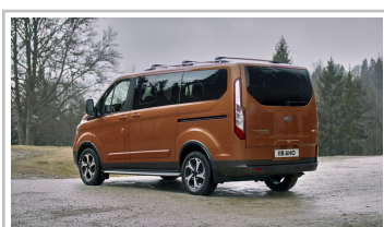
Ford Tourneo Custom Active.