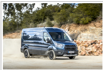
Ford Transit Trail.