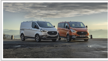
Ford Transit Custom Active und Tourneo Custom Active.