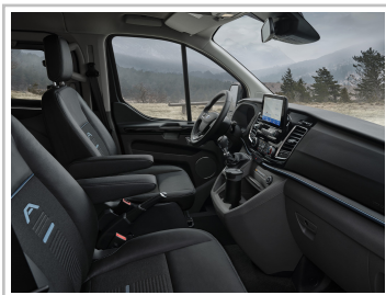
Ford Tourneo Custom Active.