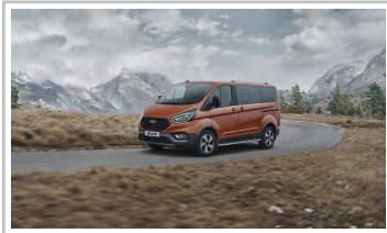
Ford Tourneo Custom Active.