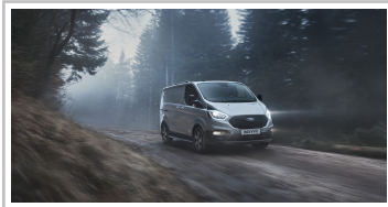
Ford Transit Custom Active.