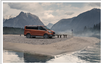
Ford Tourneo Custom Active.