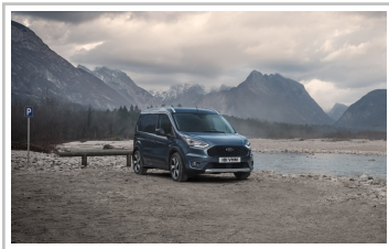
Ford Transit Connect Active