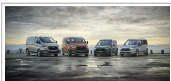
Ford Transit Custom Active, Tourneo Custom Active, Transit Connect Active und Tourneo Connect Active.