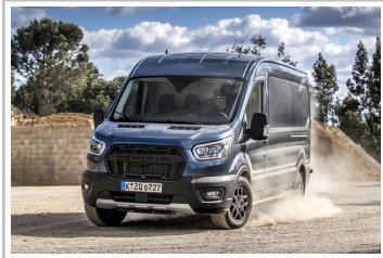
Ford Transit Trail.