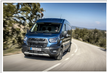
Ford Transit Trail.