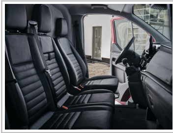
Ford Transit Custom Trail.