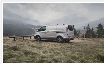
Ford Transit Custom Active.