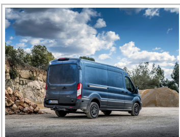
Ford Transit Trail.