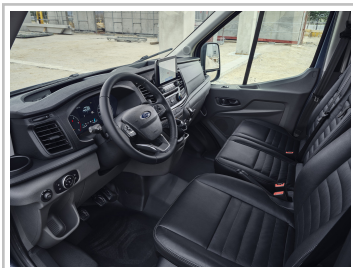
Ford Transit Trail.