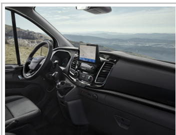
Ford Transit Custom Active.