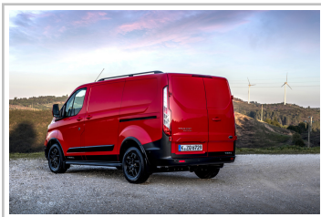
Ford Transit Custom Trail.