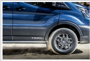
Ford Transit Trail.