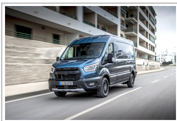
Ford Transit Trail.