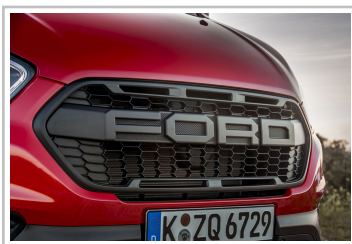
Ford Transit Custom Trail.