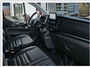
Ford Transit Custom Trail.