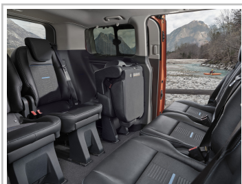
Ford Tourneo Custom Active.