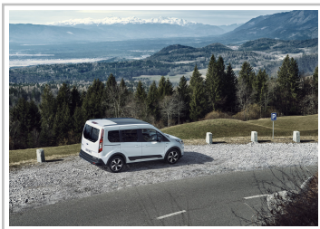
Ford Tourneo Connect Active