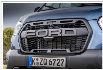
Ford Transit Trail.