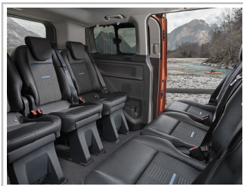
Ford Tourneo Custom Active.