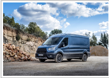
Ford Transit Trail.