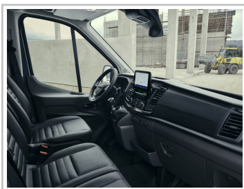
Ford Transit Trail.