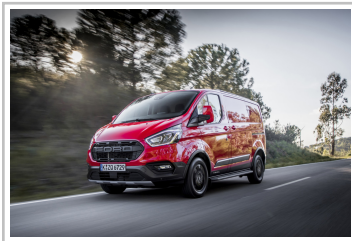
Ford Transit Custom Trail.