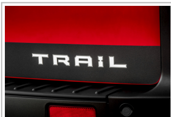
Ford Transit Custom Trail.