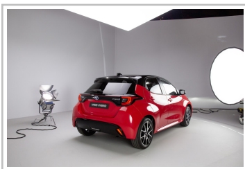
Toyota Yaris Hybrid.