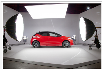
Toyota Yaris Hybrid.