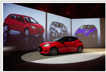
Premiere des Toyota Yaris Hybrid der vierten Generation in Amsterdam.