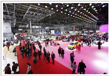
Genfer Autosalon 2014.