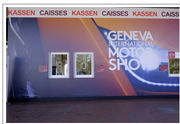
Auto-Salon Genf 2016.