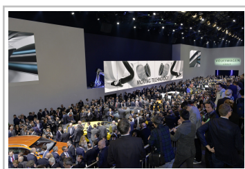
Genf 2015: Volkswagen-Konzernabend.