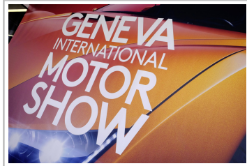
Auto-Salon Genf 2016.