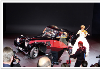
Volkswagen, "L'Esprit des Marques", Genf 2011.