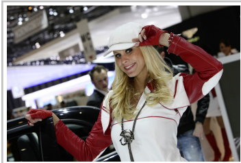
Genf 2010 - Girls.