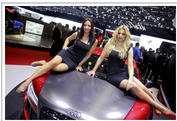
Messegirl auf dem Genfer Auto Salon 2013.