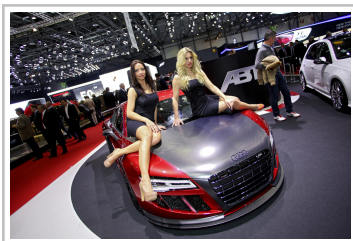
Messegirls auf dem Genfer Auto Salon 2013.