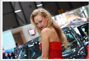
Messegirl vom Automobilsalon in Genf.