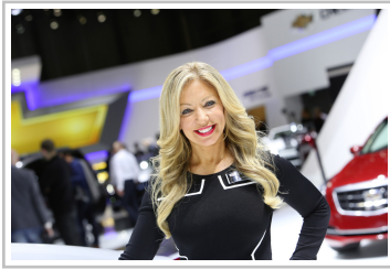
Messe-Girl in Genf.