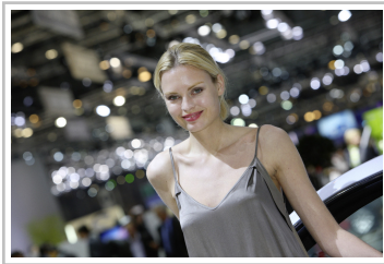
Genf 2010 - Girls.