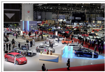
Auto-Salon Genf 2016.