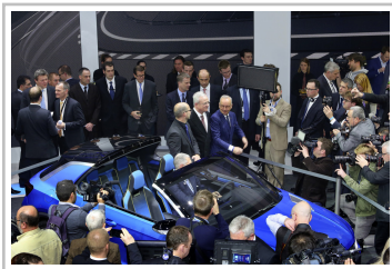
Volkswagen-Konzernabend 2014 in Genf.