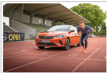
Niklas Kaul mit seinem Opel Corsa-e.