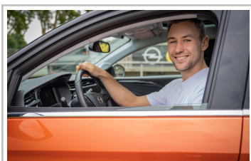
Niklas Kaul in seinem Opel Corsa-e.