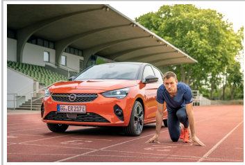
Niklas Kaul mit seinem Opel Corsa-e.