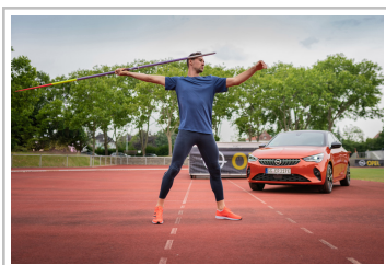
Niklas Kaul mit seinem Opel Corsa-e.