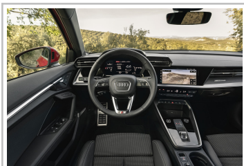
Audi A3 Sportback.