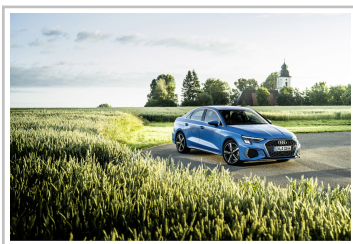
Audi A3 Limousine.