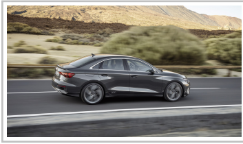
Audi A3 Limousine.