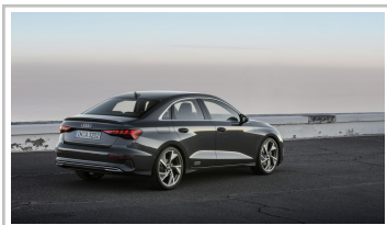
Audi A3 Limousine.