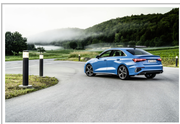
Audi A3 Limousine.