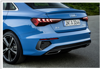
Audi A3 Limousine.