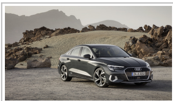
Audi A3 Limousine.