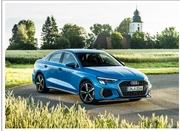
Audi A3 Limousine.