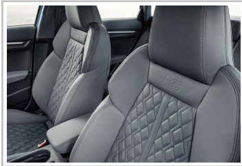
Audi A3 Limousine.