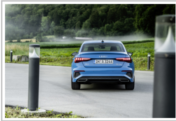
Audi A3 Limousine.