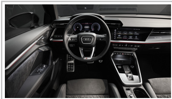
Audi A3 Limousine.