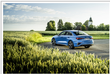
Audi A3 Limousine.