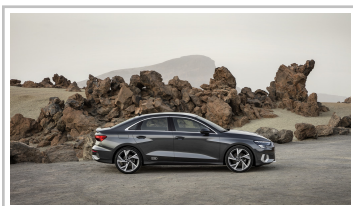
Audi A3 Limousine.