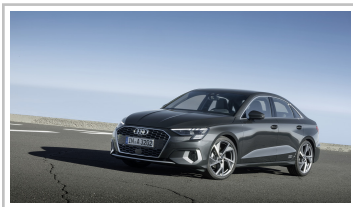
Audi A3 Limousine.