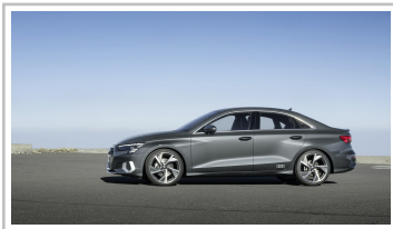
Audi A3 Limousine.