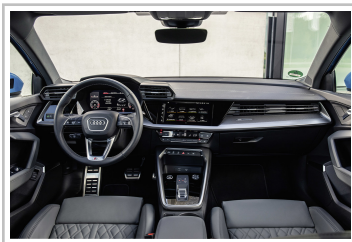
Audi A3 Limousine.