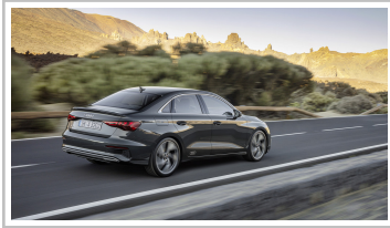
Audi A3 Limousine.