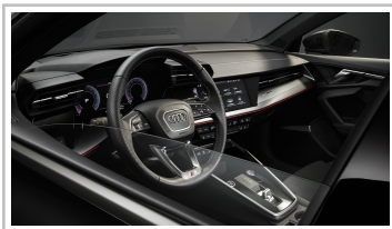
Audi A3 Limousine.