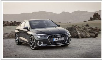
Audi A3 Limousine.