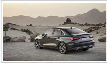
Audi A3 Limousine.