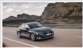
Audi A3 Limousine.