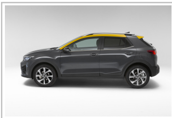
Kia Stonic GT-Line.