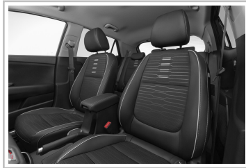
Kia Stonic GT-Line.