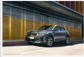
Kia Stonic GT-Line.