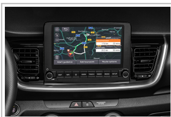
Kia Stonic GT-Line.