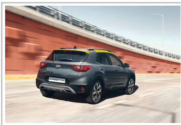
Kia Stonic GT-Line.