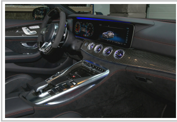
Posaidon GT 63 RS 830 Plus.