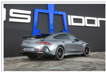
Posaidon GT 63 RS 830 Plus.