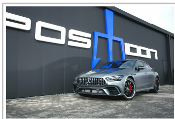
Posaidon GT 63 RS 830 Plus.