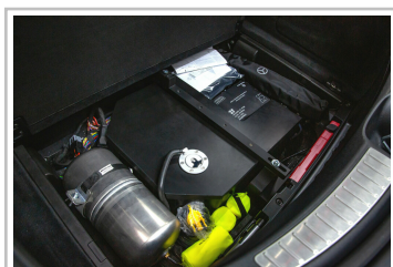
Posaidon GT 63 RS 830 Plus.