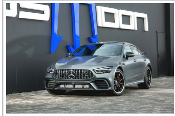
Posaidon GT 63 RS 830 Plus.