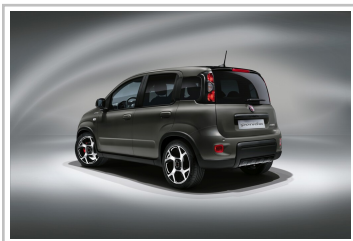
Fiat Panda Sport.