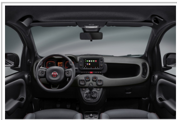
Fiat Panda Sport.