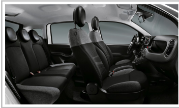
Fiat Panda City Life.