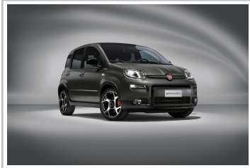
Fiat Panda Sport.