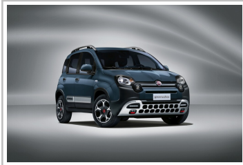
Fiat Panda Cross 4x4.