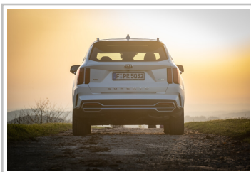
Kia Sorento Hybrid.