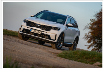
Kia Sorento Hybrid.