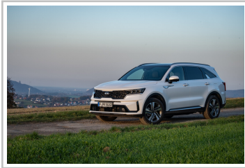
Kia Sorento Hybrid.