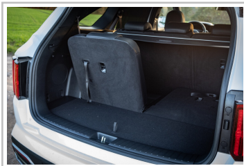
Kia Sorento Hybrid.