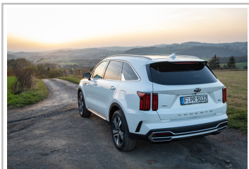
Kia Sorento Hybrid.