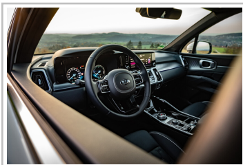
Kia Sorento Hybrid.