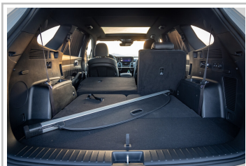
Kia Sorento Hybrid.