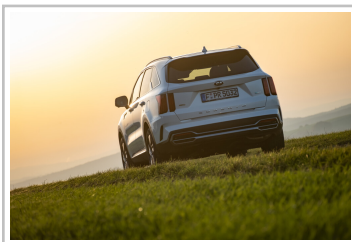
Kia Sorento Hybrid.