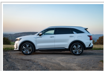
Kia Sorento Hybrid.