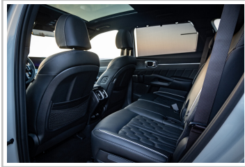
Kia Sorento Hybrid.