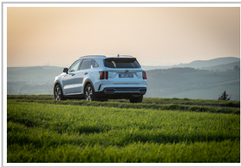
Kia Sorento Hybrid.