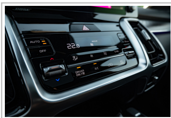
Kia Sorento Hybrid.