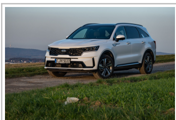
Kia Sorento Hybrid.