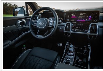
Kia Sorento Hybrid.