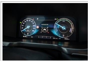
Kia Sorento Hybrid.