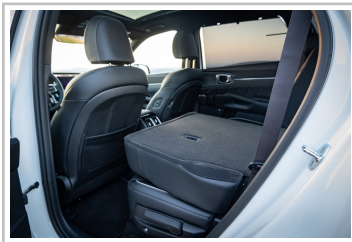
Kia Sorento Hybrid.