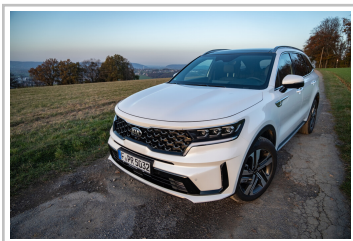
Kia Sorento Hybrid.