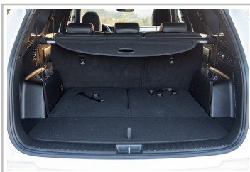
Kia Sorento Hybrid.