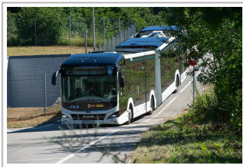
MAN Lion's City 18 E in der Erprobung.