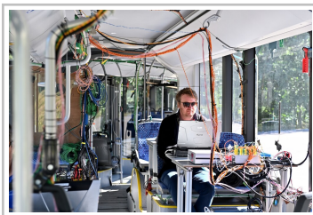
MAN Lion's City 18 E in der Erprobung.