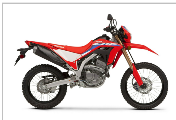
Honda CRF 300 L.