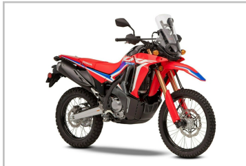
Honda CRF 300 Rally.