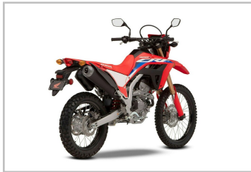
Honda CRF 300 L.