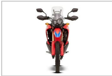
Honda CRF 300 Rally.