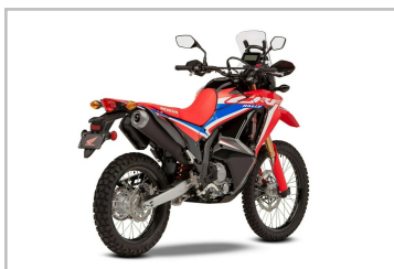
Honda CRF 300 Rally.