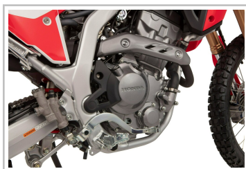
Honda CRF 300 L.