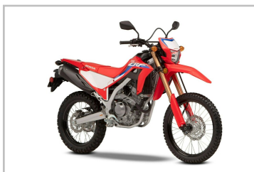
Honda CRF 300 L.