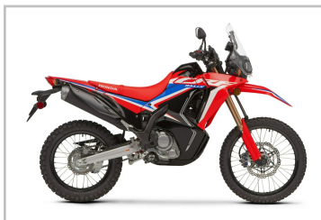
Honda CRF 300 Rally.