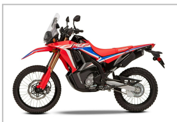
Honda CRF 300 Rally.