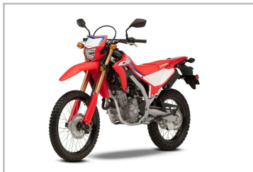
Honda CRF 300 L.