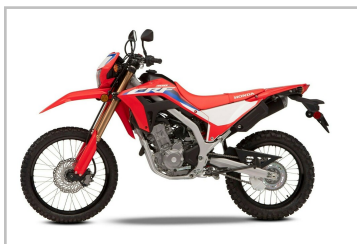
Honda CRF 300 L.