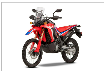
Honda CRF 300 Rally.