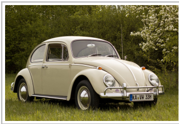
Volkswagen Käfer (1966).