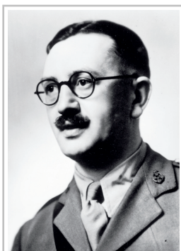
Ivan Hirst (1916–2000).