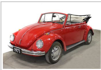
Volkswagen Käfer 1302 LS Cabrio (1971).