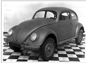
Volkswagen Typ 1 (1945).