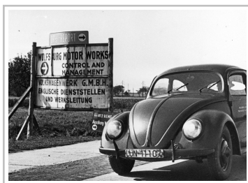
Serienstart des Volkswagen Käfer vor 70 Jahren.