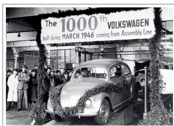
VW feierte 1946 den 1000sten Käfer.