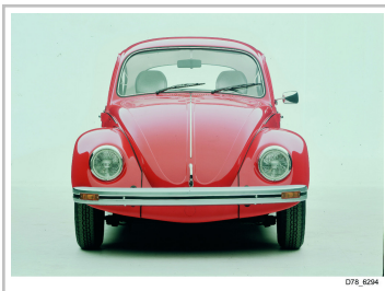
Mexiko-Käfer von 1978