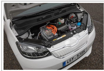
Skoda Citigo iV.