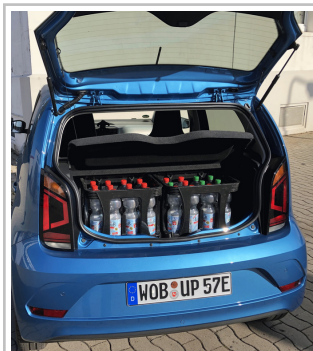
Volkswagen e-Up: Koffer fasst 16,8 Liter Mineralwasser, wenn man die Kisten vorsichtig reinzirkelt.