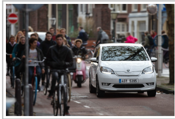
Skoda Citigo iV.