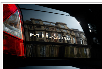
Seat Mii Electric Edition Power Charge.