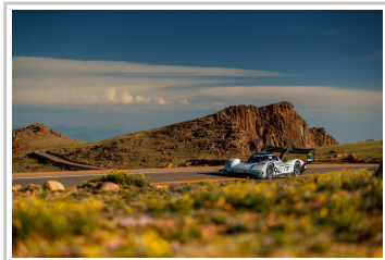
Volkswagen ID R am Pikes Peak (2018).