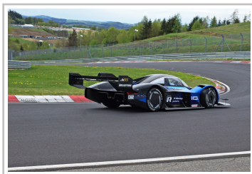
Volkswagen ID R auf dem Nürburgring.