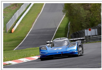
Volkswagen ID R auf der Nürburgring-Nordschleife.