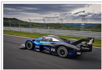
Volkswagen ID R auf dem Nürburgring (2019).