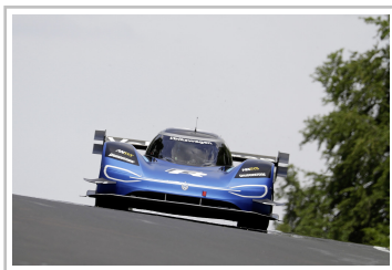
Volkswagen ID R.