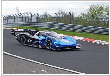
Volkswagen ID R auf dem Nürburgring.