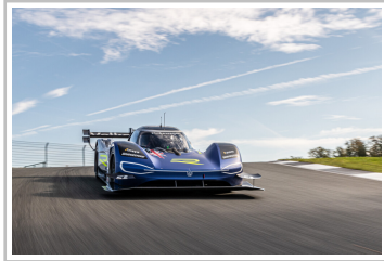
Volkswagen ID R am Bilster Berg (2020).