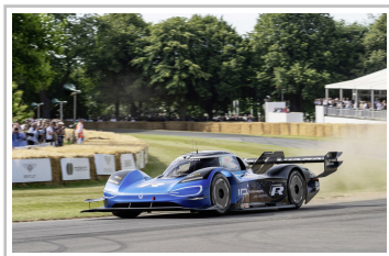
Volkswagen ID R.