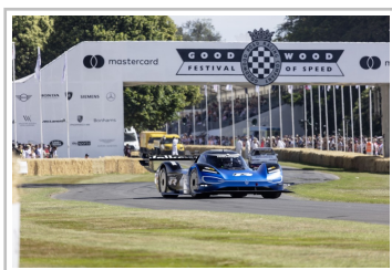
Volkswagen ID.R bei der Rekordfahrt in Goodwood 2019.