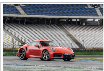
Porsche 911 Turbo.