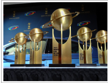
World Car of the Year 2015.