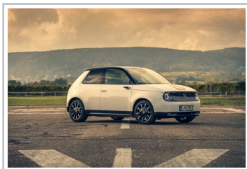
„Deutsches Auto des Jahres 2021“ in der Kategorie „New Energy“: Honda e.