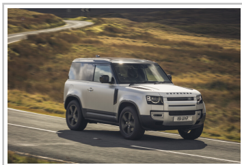
Land Rover Defender 90.