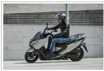
Kymco X-Town CT 300i.