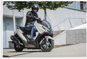
Kymco X-Town CT 300i.