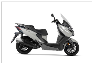
Kymco X-Town CT 125i CBS.