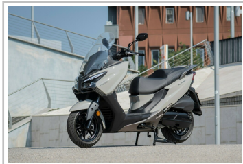
Kymco X-Town CT 300i.