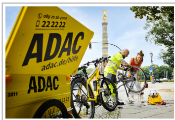
ADAC-Pannenhilfe für Fahrradfahrer.