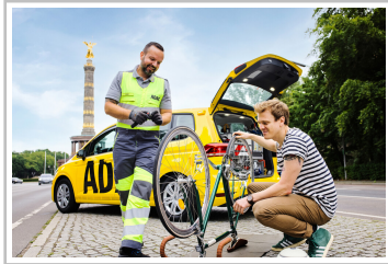
ADAC-Pannenhilfe für Fahrradfahrer.