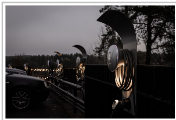
Charge Amps Halo.