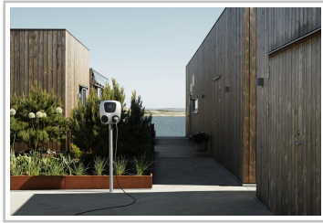
Charge Amps Aura.