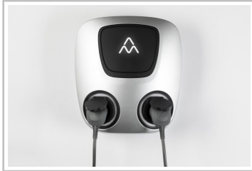
Charge Amps Aura.