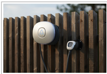
Charge Amps Halo.