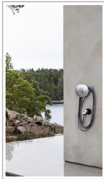
Charge Amps Halo.