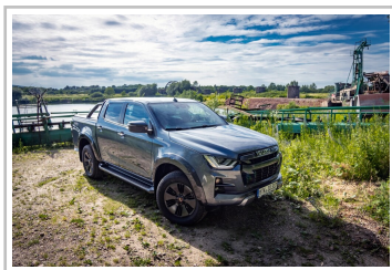
Isuzu D-Max V-Cross.