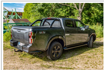
Isuzu D-Max V-Cross.