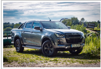
Isuzu D-Max V-Cross.