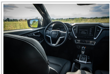
Isuzu D-Max V-Cross.