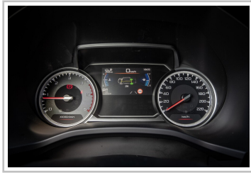
Isuzu D-Max V-Cross.