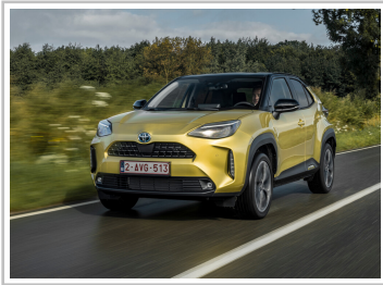
Toyota Yaris Cross.