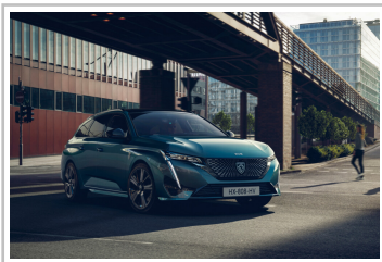
Peugeot 308 SW.