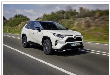
Toyota RAV4 Plug-in Hybrid.