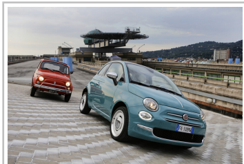
Fiat 500 in Turin.