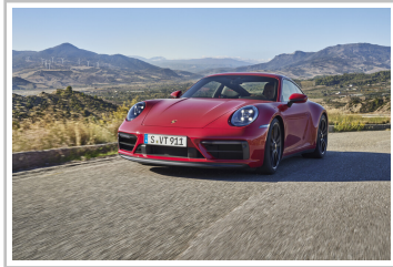
Porsche 911 Carrera GTS.