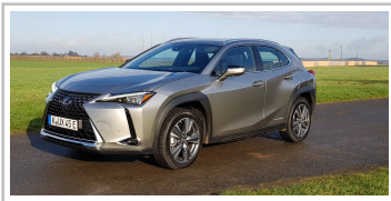
Lexus UX 300e.