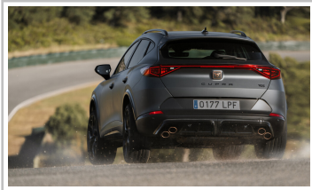
Cupra Formentor VZ5.