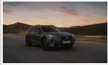
Cupra Formentor VZ5.