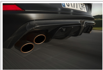
Cupra Formentor VZ5.