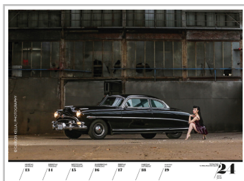
Wochenkalender „Girls & legendary US-Cars 2022“.