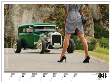
Wochenkalender „Girls & legendary US-Cars 2022“.