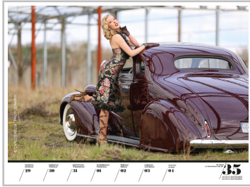
Wochenkalender „Girls & legendary US-Cars 2022“.