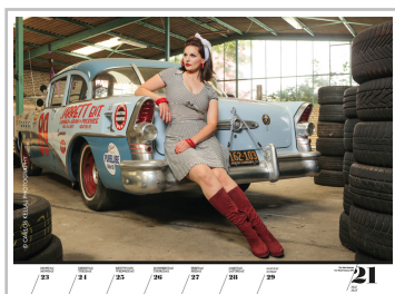
Wochenkalender „Girls & legendary US-Cars 2022“.