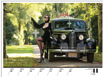
Wochenkalender „Girls & legendary US-Cars 2022“.