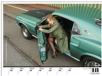
Wochenkalender „Girls & legendary US-Cars 2022“.