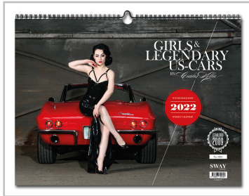
Wochenkalender „Girls & legendary US-Cars 2022“.