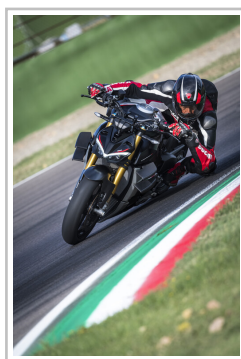
Ducati Streetfighter V4 SP.