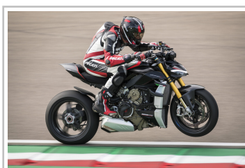
Ducati Streetfighter V4 SP.