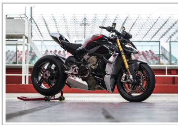
Ducati Streetfighter V4 SP.