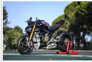
Ducati Streetfighter V4 SP.