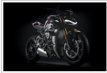
Ducati Streetfighter V4 SP.