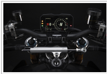
Ducati Streetfighter V4 SP.