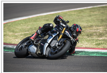
Ducati Streetfighter V4 SP.