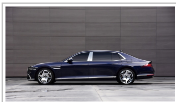
Genesis G90 Langversion.