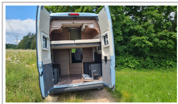
Knaus Boxlife 630 ME.