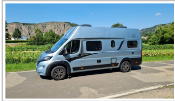
Knaus Boxlife 630 ME.