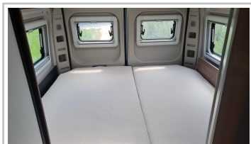
Knaus Boxlife 630 ME.