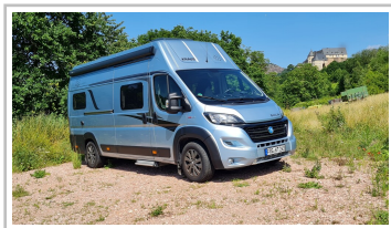
Knaus Boxlife 630 ME.