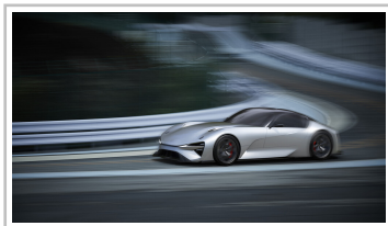
Lexus Elektro-Sportwagenstudie.