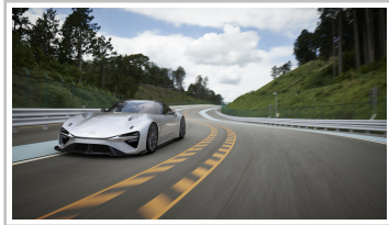
Lexus Elektro-Sportwagenstudie.