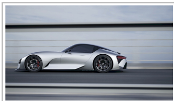
Lexus Elektro-Sportwagenstudie.