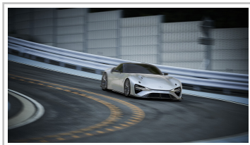
Lexus Elektro-Sportwagenstudie.