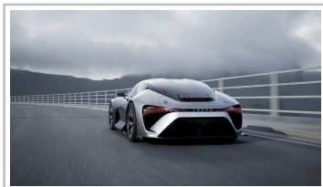
Lexus Elektro-Sportwagenstudie.