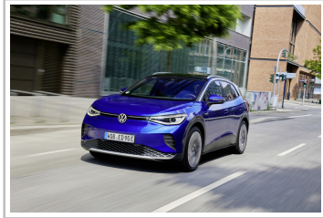
VW ID 4.