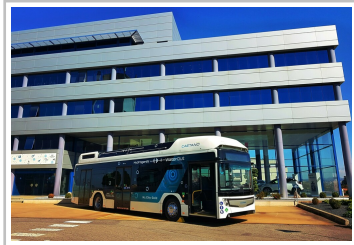
Caetano H2 City Gold.