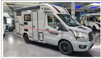
Challenge Sport Edition.