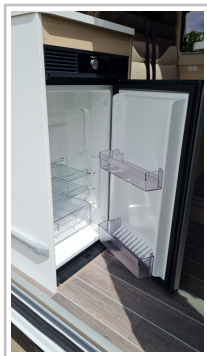
Kühlschrank, beidseitig zu öffnen.