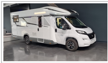
Mobilevetta Kea 590.