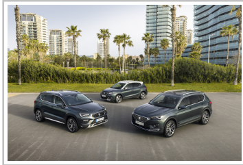
Seat Tarraco Xperience.