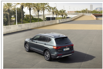
Seat Tarraco Xperience.