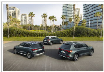
Seat Tarraco Xperience.