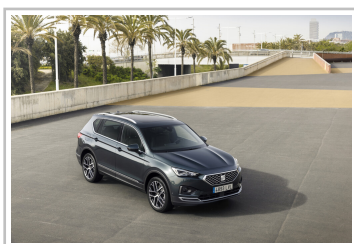
Seat Tarraco Xperience.