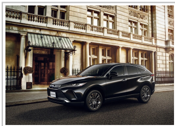
Toyota Harrier (2020).