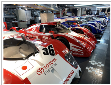
Toyota-Motorsportsammlung in Köln.