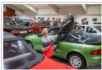
Toyota Sera Coupé in der Toyota Collection.