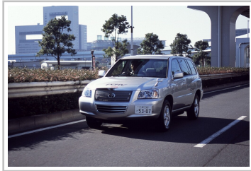
Toyota FCHV (2002).