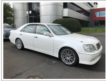
Toyota Crown Athlete (1999).