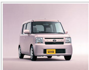
Toyota Pixis Space (2011).