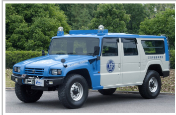
Toyota Mega Cruiser als Einsatzfahrzeug.