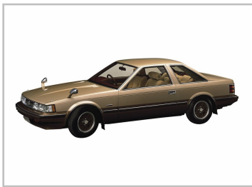
Toyota Soarer (1981).