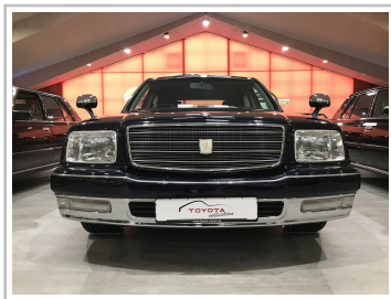
Toyota Century V12 in der Toyota Collection.