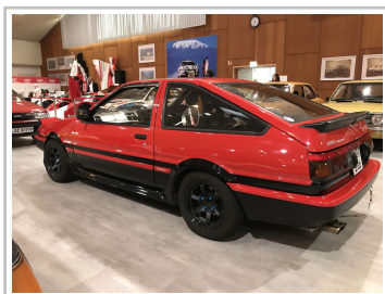
Toyota Trueno Sprinter (1983) in der Kölner Toyota Collection.