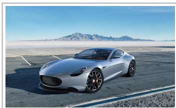
Piëch Mark Zero.