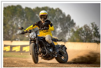
Ducati Scrambler Full Throttle.