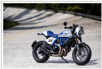
Ducati Scrambler Café Racer.