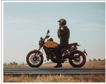
Ducati Scrambler 1100 Tribute Pro.