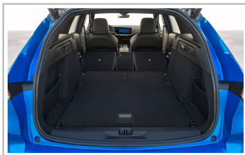
Opel Astra Sports Tourer.