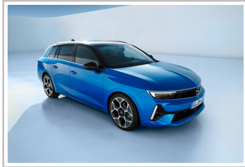
Opel Astra Sports Tourer.