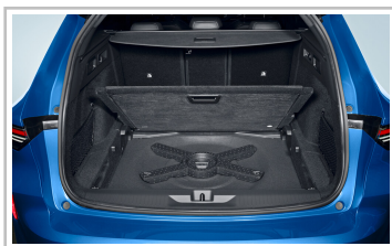
Opel Astra Sports Tourer.