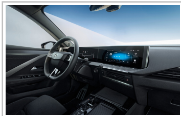
Opel Astra Sports Tourer.