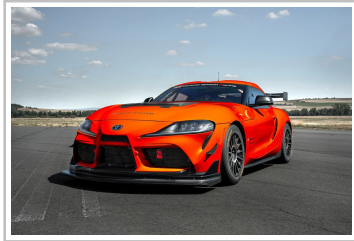
Toyota GR Supra GT4 Evo.