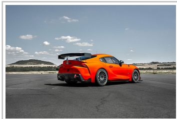
Toyota GR Supra GT4 Evo.