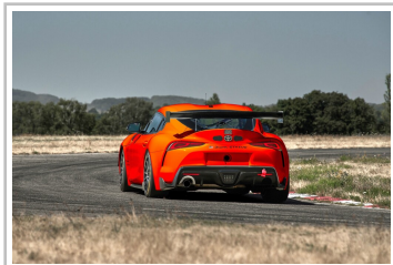
Toyota GR Supra GT4 Evo.