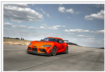
Toyota GR Supra GT4 Evo.