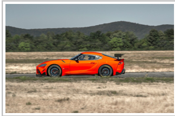
Toyota GR Supra GT4 Evo.