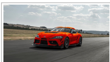
Toyota GR Supra GT4 Evo.