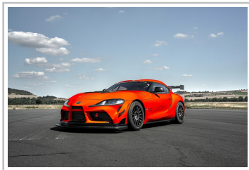
Toyota GR Supra GT4 Evo.