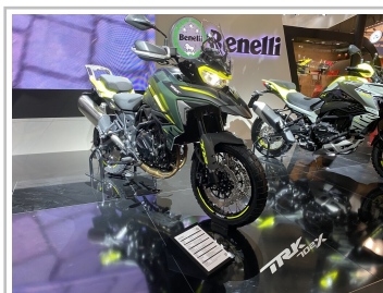
EICMA 2022: Benelli TRK 702 X.