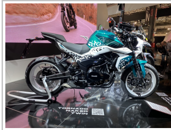
EICMA 2022: Benelli TNT 500.