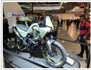
EICMA 2022: Benelli BKX 250.