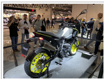
EICMA 2022: Benelli BKX 250 S.