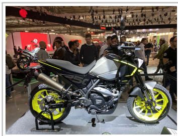
EICMA 2022: Benelli BKX 250 S.