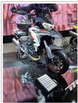
EICMA 2022: Benelli TRK 702.