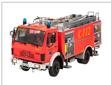
Modellfahrzeug des Jahres 2022: Mercedes-Benz 1625 TLF 24/50 von Revell (1:24).