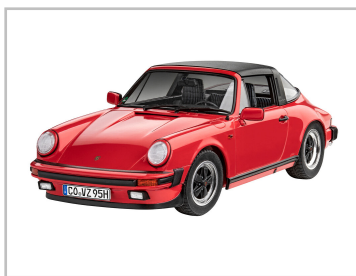
Modellfahrzeug des Jahres 2022: Porsche 911 Targa (G-Modell) von Revell (1:24).