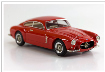
Modellfahrzeug des Jahres 2022: Maserati A6G/54 Zagato von ABC Brianza (1:43).