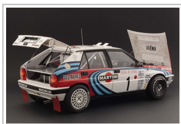
Modellfahrzeug des Jahres 2022: Lancia Delta Integrale HF 16V von Italeri (1:12).