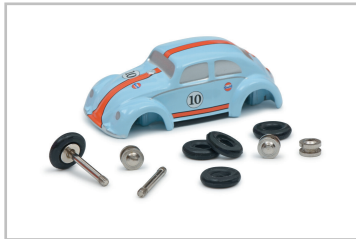
Modellfahrzeug des Jahres 2022: VW Käfer „Gulf“ von Schuco/MHI (1:90),

Foto: Autoren-Union Mobilität/Delius-Klasing-Verlag