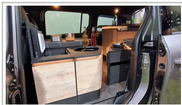
Mercedes EQT Marco Polo Concept.