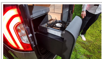
Mercedes EQT Marco Polo Concept.