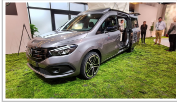
Mercedes EQT Marco Polo Concept.