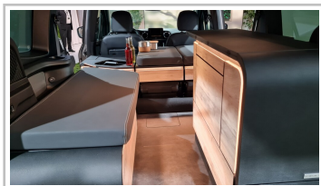
Mercedes EQT Marco Polo Concept.