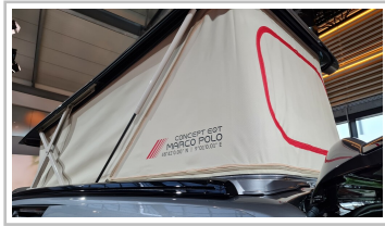
Mercedes EQT Marco Polo Concept.