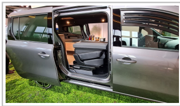
Mercedes EQT Marco Polo Concept.