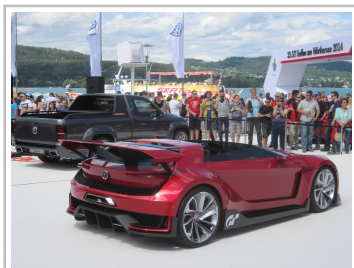
Wörthersee 2014: VW GTI Roadster Vision GT.