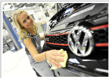
Arbeit am Wörthersee Golf von Volkswagen.