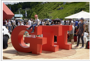
GTI-Treffen am Wörthersee.