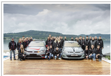
Gruppenbild mit den Golf Aurora und FichteR und den Auszubildenden von Volkswagen im Rahmen des GTI Treffens 2019 am Wörthersee.