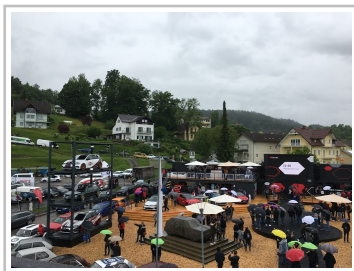
GTI-Treffen 2019 am Wörthersee.