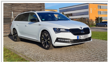
Skoda Superb Combi 4x4.