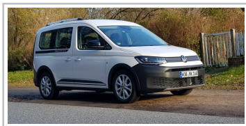
VW Caddy Pan Americana.