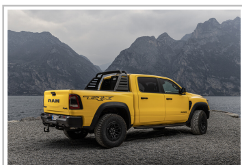
RAM 1500 TRX Havoc Edition.