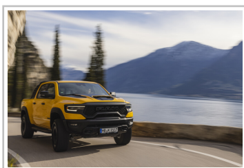
RAM 1500 TRX Havoc Edition.