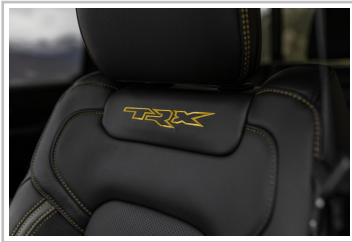
RAM 1500 TRX Havoc Edition.