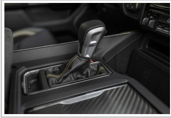
RAM 1500 TRX Havoc Edition.