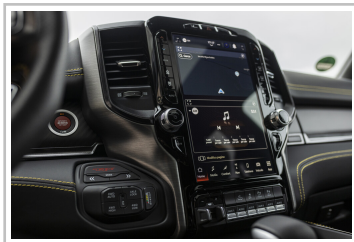
RAM 1500 TRX Havoc Edition.