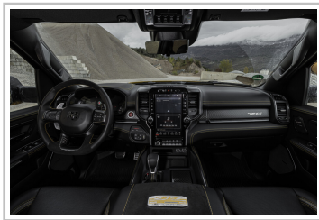
RAM 1500 TRX Havoc Edition.