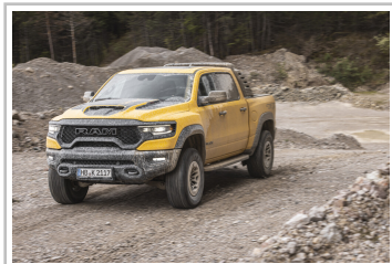
RAM 1500 TRX Havoc Edition.