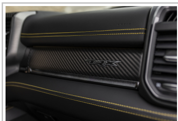
RAM 1500 TRX Havoc Edition.