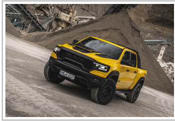
RAM 1500 TRX Havoc Edition.