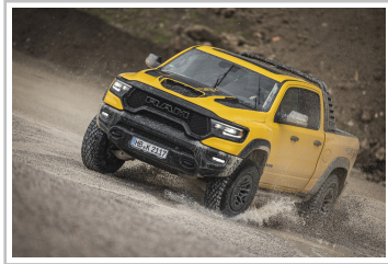
RAM 1500 TRX Havoc Edition.