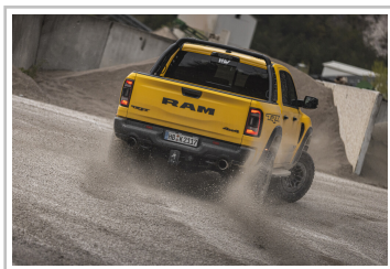
RAM 1500 TRX Havoc Edition.