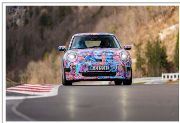
Mini Cooper Electric.