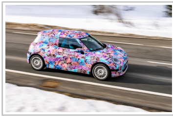
Mini Cooper Electric.