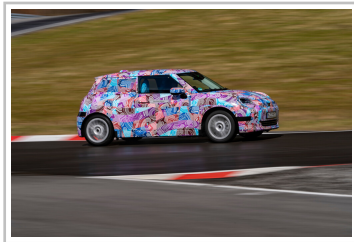
Mini Cooper Electric.