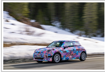
Mini Cooper Electric.