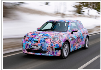
Mini Cooper Electric.