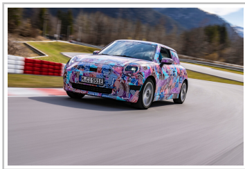
Mini Cooper Electric.