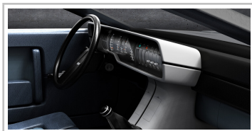
Hyundai Pony Coupé Concept.