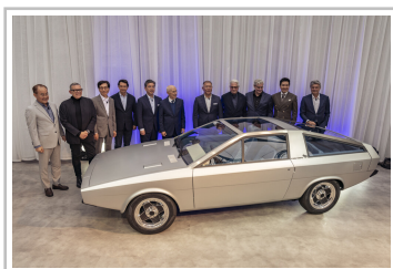
Hyundai Pony Coupé Concept.