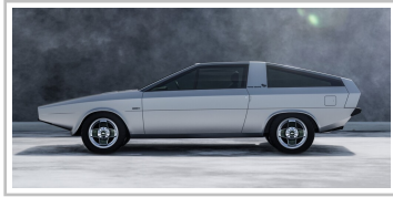
Hyundai Pony Coupé Concept.