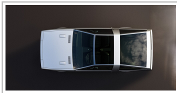
Hyundai Pony Coupé Concept.