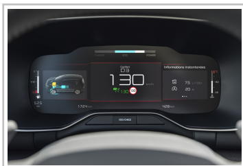
Citroën C5 Aircross Hybrid 136 ë-DCS6.