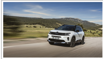
Citroën C5 Aircross Hybrid 136 ë-DCS6.