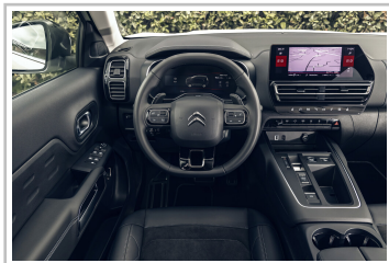
Citroën C5 Aircross Hybrid 136 ë-DCS6.