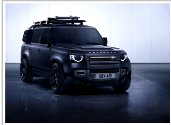
Land Rover Defender 130 Outbound.