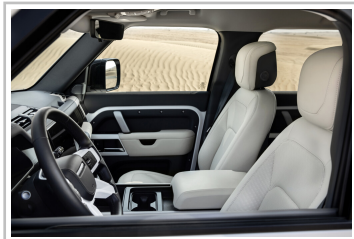
Land Rover Defender 130 Outbound.