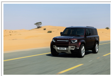
Land Rover Defender 130 Outbound.