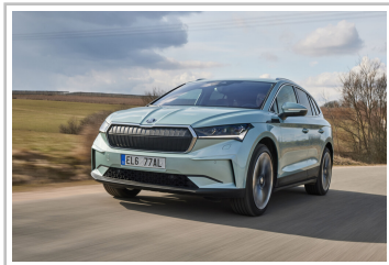
Skoda Enyaq iV 80x.