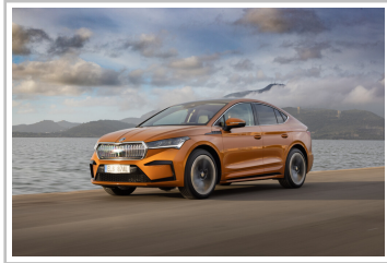
Skoda Enyaq Coupé iV 80x.