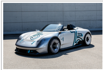
Porsche Vision 357 Speedster.