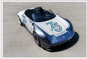
Porsche Vision 357 Speedster.