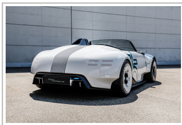
Porsche Vision 357 Speedster.