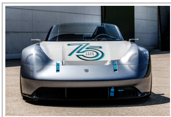
Porsche Vision 357 Speedster.