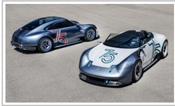
Porsche Vision 357 und Vision 357 Speedster.